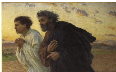
Pedro y Juan corriendo hacia el sepulcro. E. Burnand. Museo d'Orsay (Paris)